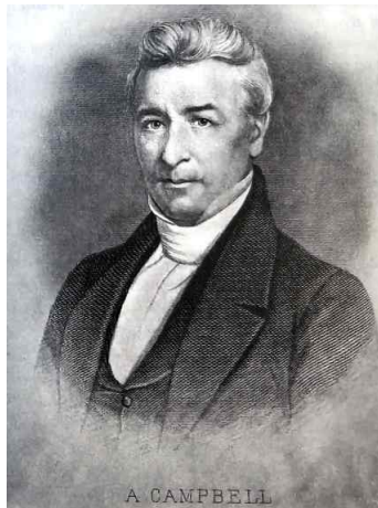
[41세 때의 알렉산더 캠벨. 웨스트버지니아 주 베다니 소재 그리스도의 제자들 역사학회의 허가를 받아 사용됨.]

캠벨이 1851년에 『그리스도인 침례: 그것의 전례들과 결과들』( Christian Baptism: With Its Antecedents and Consequents )을 출판할 때까지 루넨버그 서신 관련 글들에서 그가 쓴 포괄적 진술들에는 어렵פות한 이해만이 남아 있었는데, 주로 그 책 끝에 있는 교리문답의 세 가지 질문에 대한 답변들이었다. 126번 질문, 곧 “많은 그리스도인들이 그들의 유아들에게 약식세례를 베풀거나 유아기에 세례를 베풀지 않는가?”에 대한 대답에서 그는 많은 그리스도인들이 실제로 유아세례 관행에 정말 관여하고 있다는 것을 인정하였다. 다음 대답에서 캠벨은 유아들에게 세례를 베풀고 다른 “인위적인 전통들”을 실천하는 많은 사람들이 선한 사람들이라고 말하였다. 그리고 유아에게 베푸는 약식세례의 효과에 관한 128번 질문에 대한 답변에서 캠벨은 옳다고 생각하는 행위를 실행하는 것과 그것의 정확성을 의심하거나 잘못된 것임을 알면서도 그것을 행하는 것을 대조하였다. “전자는 단순한 실수이고 후자는 고의적인 범법이다.” 그러나 캠벨은 계속해서 129번 항목에서 진리에 접근하기만 하면 진리를 알 수 있는데도 그렇게 하지 않은 모두는 고의적인 범주를 저지른 것이라고 말하곤 했다. 성부와 성자와 성령의 이름으로 침수세례를 받은 자 외에는 어느 누구도 참으로 침례를 받았다고 주장할 수 없다고 그는 131번 항목에서 단언하였다. 33)