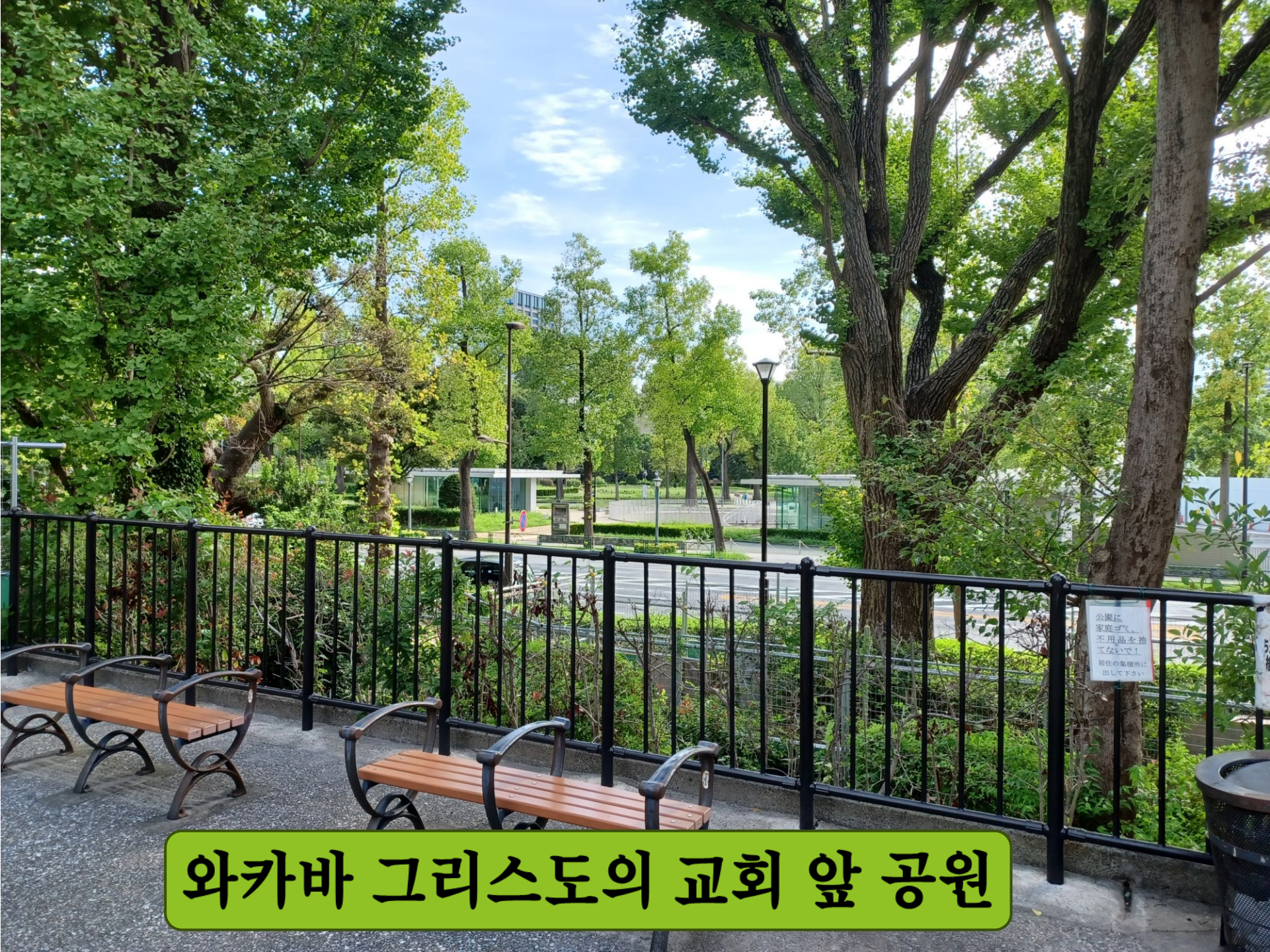
와카바 그리스도의 교회 앞 공원