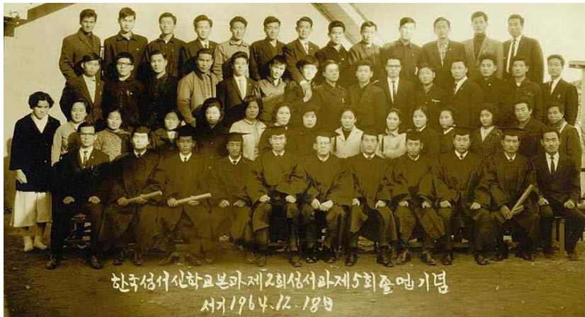
한국성서신학교본과제2회심서과제5회졸업기념 서기 1964.12.18일