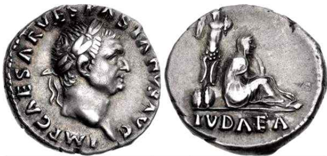
베스파시아누스의 유대정복 기념주화(데나리온, AD 69-79)

로마가 유대와와의 전쟁에서 승리한 이듬해에 주조된 금화로서 전면면에 월계관만 베스파시아누스의 두상을 새겼고, 뒷면에 IMP CAES VESPASIAN AVG(임페라토르 캐서르 베스파시아누스 아우구스투스)라고 새겼다. 뒷면에 왼팔을 턱에 댄 채 슬픔에 빠진 유대인 여성(유대를 상징)을 전라꽃과 함께 새겼고, 그 밑에 IVDAEA(유대)라고 새겼다.