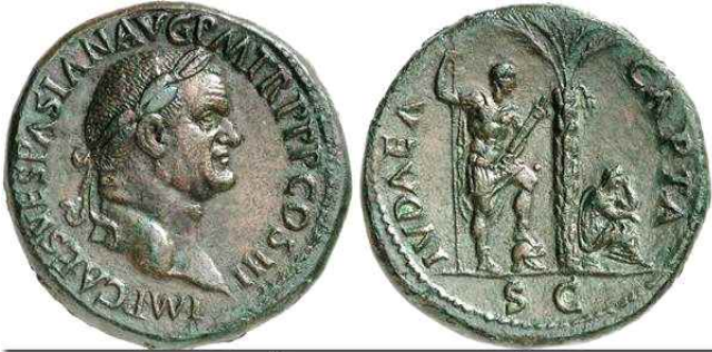
베스파시아누스 황제의 세스테르티우스 주화(AD 71)

주후 70년 이스라엘 멸망이후 예멘에 이주한 유대인은 2천년 가까이 문명 세계와 격리된 채 살아 왔다. 한데 어느 날 풍문으로 약속의 땅 팔레스타인에 자기네 조국 이스라엘이 세워졌다는 소식을 듣고 2천년 동안 기다렸던 그 약속이 실현되었음을 안 순간 4만3천명의 유대인들은 냄비 쪽과 명석 하나 맡아 메고 모든 재산을 버린 채 이스라엘로 돌아왔다. 마치 버스 정거장에서 다음 버스 기다리듯 2천년을 기다리게 하는 원동력이 바로 시오니즘이다 (이규태. “시오니즘.” 조선일보. 1997년 8월 30일자 칼럼 참고).