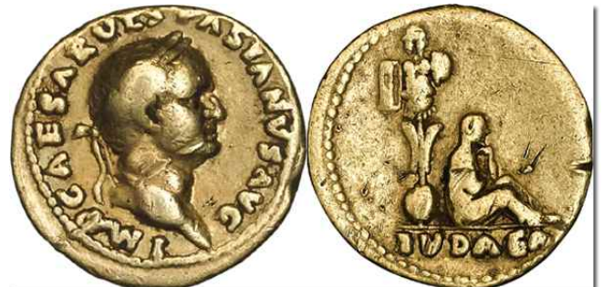
베스파시아누스의 유대정복기념 금화(AD 71)

전면면에 월계관만 베스파시아누스의 두상을 새겼고, 뒷면에 IMP CAES VESPASIAN AVG(임페라토르 캐서르 베스파시아누스 아우구스투스)라고 새겼다. 뒷면에 대추야자나무 곁에서 베일을 쓰고 주저앉은 양팔이 뒤로 묶인 채로 슬픔에 빠진 유대인 여성(유대를 상징)을 새겼고, 그 밑에 IVDAEA(유대)라고 새겼다.