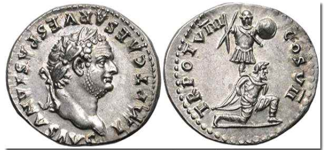
티투스의 유대정복 기념주화(데나리온, AD 79)

전면면에 월계관을 쓴 베스파시아누스의 두상을, 뒷면에 IMP CAESAR VESPASIANVS AVG(임페라토르 캐서르 베스파시아누스 아우구스투스)라고 새겼다. 뒷면에 베일을 쓰고 주저앉아 왼팔을 턱에 댄 채 슬픔에 빠진 유대인 여성(유대를 상징)을 전라꽃과 함께 새겼다.