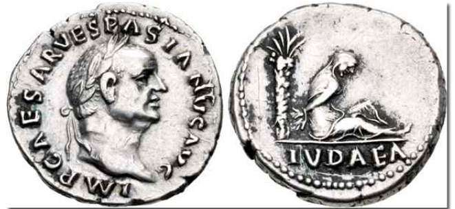
베스파시아누스의 유대정복기념 은화(AD 69-70 데나리온)

로마가 유대와와의 전쟁에서 승리한 이듬해에 주조된 청동 세스테르티우스(Sesterterius)로서 전면면에 월계관을 쓴 베스파시아누스의 두상을 새겼고, 뒷면에 IMP CAES VESPASIAN AVG P M TR P P P COS III (임페라토르 캐서르 베스파시아누스 아우구스투스 대제관 호민관 국부 재상관 3회)라고 새겼다. 뒷면에 대추야자나무를 중앙에 새겼고, 우측에 슬픔에 잠긴 유대인 여성 포로(노예)를 좌측에 베스파시아누스가 오른손에 창을 왼손에 호신봉 단검(parazonium)을 왼쪽 발을 투구 위에 올려놓은 모습을 새겼다. 그리고 뒷면에 IVDAEA CAPTA(유대 정복되다)라고 새겼다. 중앙 하단의 SC는 Senatus co. n. s. ultio의 약자이며 '원로원의 법령에 따라'란 뜻으로써 백성이 순종해야 할 제도의 권위를 보여준다(벤진 2:13).